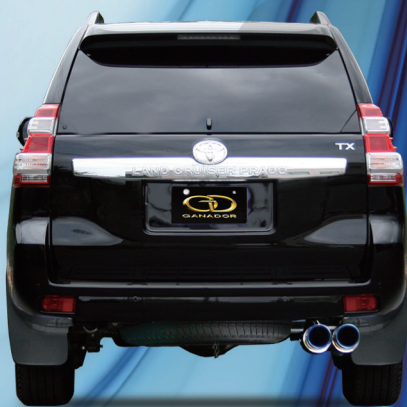
上記マフラーは、サークルブルーテールです。