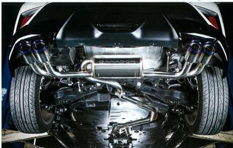
テール部バリエーションは2種を設定