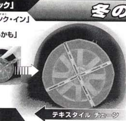
テキスタイル チェーン