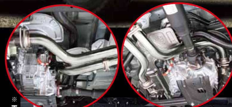
※画像は、すべてバン用