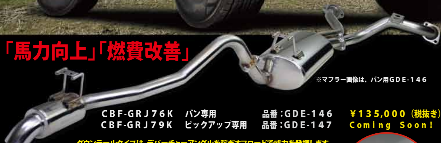
※マフラー画像は、バン用GDE-146

CBF-GRJ76K バン専用 品番: GDE-146 CBF-GRJ79K ピックアップ専用 品番: GDE-147