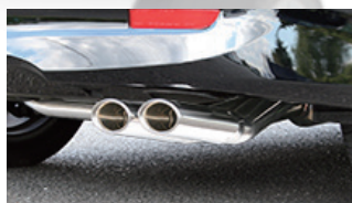
REAR SIDE VIEW